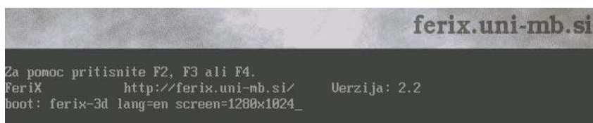
Slika 1: Opcije pri zagonu

Naš cilj je bil izdelava distribucije primerne za študente elektrotehnike in da je ni potrebno namestiti na računalnik, torej da deluje iz CD oz. DVD plošče. Iz tega izhaja tudi angleški naziv live oz. po naše živa distribucija. Ker deluje direktno iz DVD plošče pomeni, da bo deloval sistem počasneje kakor pri inštalaciji na disk, vendar je prednost v tem, da jo lahko preizkusimo, ne da posegamo v svoj računalniški sistem. Kakor pri vseh odprtokodnih projektih ni cilj odkrivanje tople vode, zato je bila za osnovo FeriXa vzeta zelo prilagodljiva Linux distribucija z imenom KNOPPIX 4.0.2 [1, 2], ki se ga lahko najde na www.knoppix.net , druge možnosti lahko najdete na distrowatch.com . Osnovni sistem je na KNOPPIX-u enostavno vzpostaviti ter posloveniti, pomemben pa je nabor uporabniškega programja, ki bi znalo priti prav študentom na FERIJU. V nadaljevanju bo tako podan kratek opis izbranih programskih paketov. Zavedati se moramo, da to ni končno stanje, kajti ne poznamo vseh paketov in dnevno se pojavi kakšen novi.