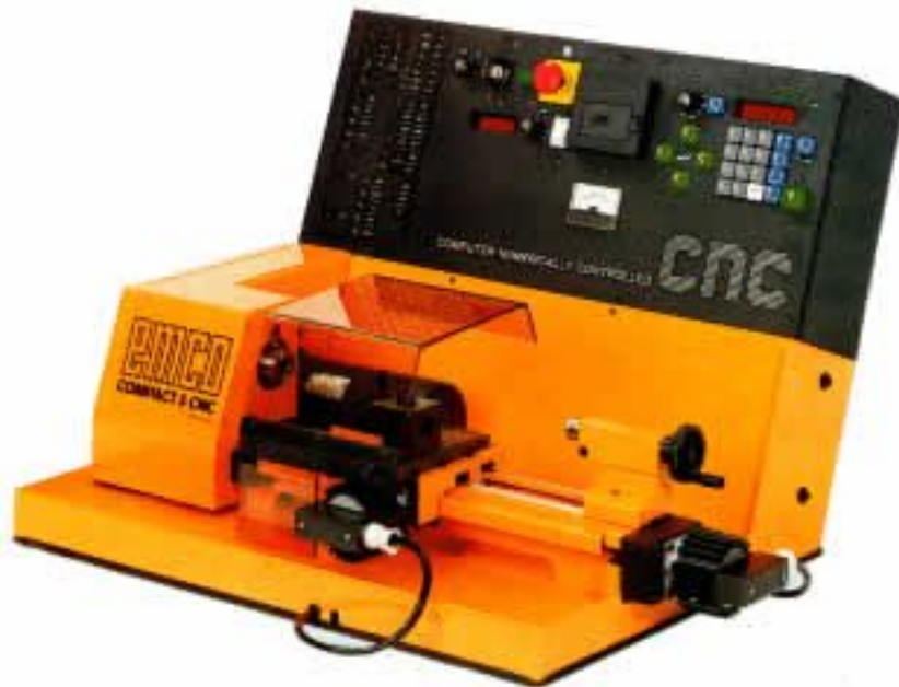
Slika 3: Stružnica vodena s PC-jem

tako pa na FeriX wikiju ( http://ferix.uni-mb.si/wiki ) najdete opise ter bazo znanj za lažji začetek uporabe in seznanjanja s FeriX živim sistemom.